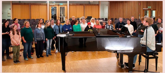
Første korøvelse med prosjektkoret i Ålgård kirke i slutten av januar.

–Med denne lederen blir det knallgøy! Dessuten er det så mange fine stemmer i koret. Det låt skikkelig bra etter bare kort tid, ivrer han.