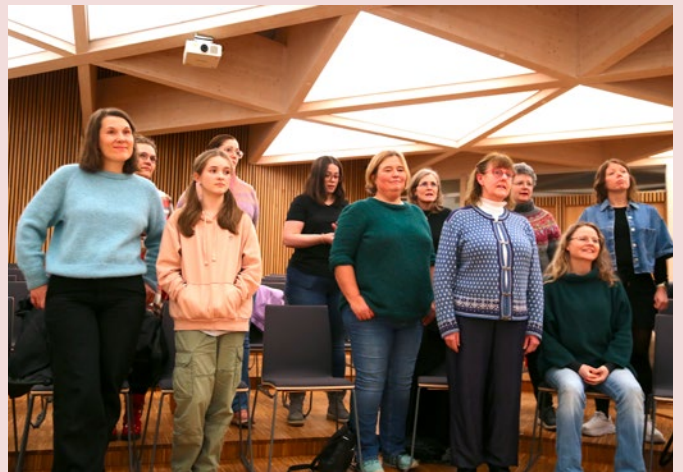
Flere generasjoner synger sammen i prosjektkoret som debutterer under jubileumsgudstjenesten i Ålgård kirke 16. mars.

–Vi må ha mange sanger, kommer det fra en annen inspirert prosjektkorsanger.